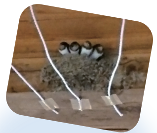
毎年、遊学舎の玄関で つばめの巣作りがはじまります。 写真は昨年の様子です。 「餌を待つ小つばめたち」