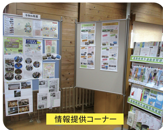
情報提供コーナー