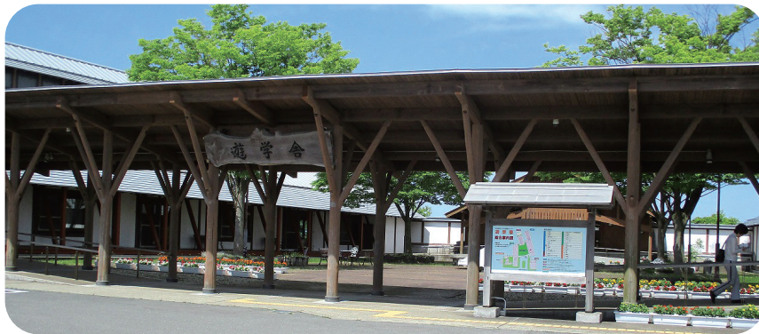
秋田拠点が入居している秋田県ゆとり生活創造センター「遊学舎」 あきた市民活動サポートセンター