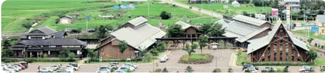
秋田県ゆとり生活創造センター「遊学舎」 あきた中央市民活動サポートセンター

福島県から青森・岩手・秋田に避難されている方々の避難生活の事、日々の生活の困り事、悩みや不安など様々なご