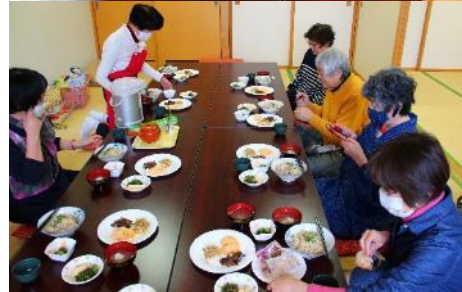
本日一番のお楽しみ!!