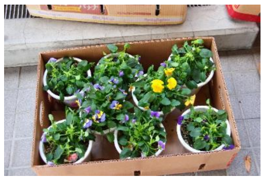
パンジーの鉢植え 11月27日撮影

「であいのこんさあと」でいただきました。私達が作った「であいのはな」も添えられたパンジーです。