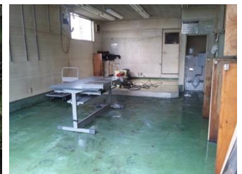
作業後こんなにきれいに…