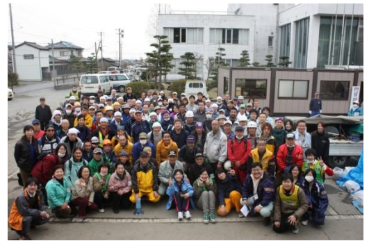
全国から集まったボランティアの皆さん