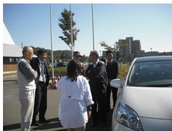
ハイブリット車の静かな走行に驚きの参加者でした。

ハイブリット車を体感していただいた後で、WSを実施しました。参加者には、車の性能の進歩に驚いた半面、高齢者や障害を持つ方には歩行中の危険度が高まるといった感想や、歩行者としての注意点など、積極的な意見を出していただき、大変有意義なWSを行うことが出来ました。今後もこのような体験会を実施し、交通事故防止の一役を担いたいと思います。参加者は体験会13名、WS7名でした。