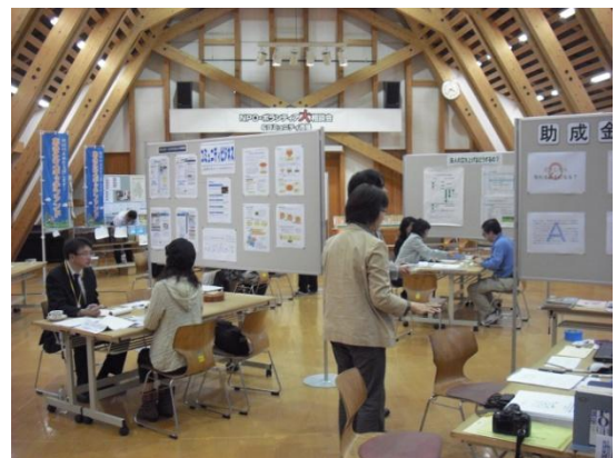
多くの相談者が訪れました。

今年度は企業の協力を得てCSR(企業の社会貢献活動)コーナーを設け、様々な形で社会貢献している企業6社を紹介しました。