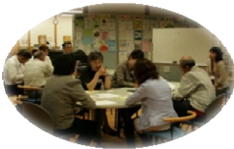
真剣に課題を出し、話し合う参加者

その結果11票を集めた「おしゃべりナイトルーム」に決定。休憩を挟んだ後半にはそれぞれの団体の課題や悩みをグループごとに出し合い、その後全体で話し合いました。終わりに次回の開催を8月25日（水）に決定し散会しました。（この会は5回の開催予定です）