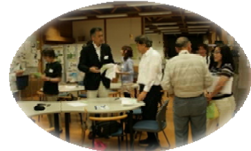
自己紹介カードの交換中

6月23日（水）午後6時半から、いろいろな団体、個人など10名が参加し、第1回車座会議（仮称）が開かれました。これは様々な人や団体がつながり、一緒にできることを考える会です。各自が書いた自己紹介カードの交換をした後、2グループに分かれて会の正式名称を決めるための案を出し合い、全員で投票しました。