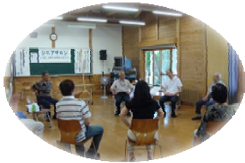
いろんな話が出ました