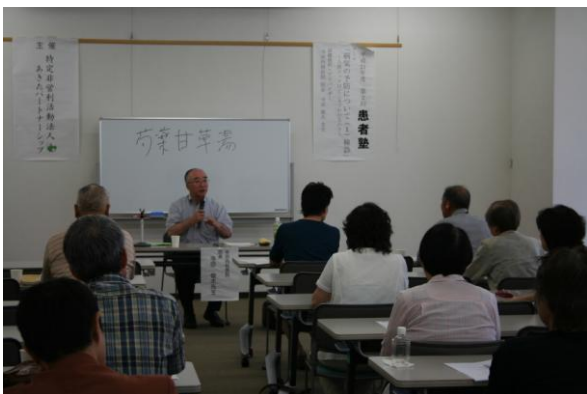
第3回患者塾の様子