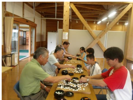
囲碁の体験「囲碁キッズ」の様子