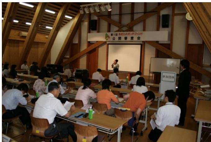
NPO 法人あきたスギッチファンド 第1回公開審査プレゼンの様子

NPO 法人あきたスギッチファンドの第1回目の公開審査会が7月15日(水)遊学舎で行われました。43 団体から申し込みがあり、書類審査を通過した 30 万コース、12 団体と、東邦技術㈱の寄付による『TOHO 子育て安心ファンド』の、書類審査を通過した 2 団体、計 14 団体がプレゼンテーションを行いました。結果、選考委員会による厳正な審査により 30 万円の助成金が 7 団体、冠ファンドが 1 団体、書類選考によって決定した 10 万円の 9 団体が助成団体に決まりました。団体名等くわしいことはあきたスギッチファンドのホームページや8月号の「かだれ」に掲載されます。