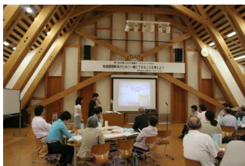
企業とNPOの協働ワークショップの様子

協働のヒントが得られたという団体もあり、12月1日に開催予定の「CSR(企業の社会的貢献)セミナー」へつなげたいと考えています。