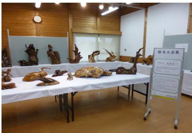
開催中の根木工芸展