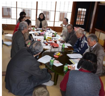
昭和館にて、総会の様子