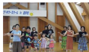
親子で踊ろうフラダンス