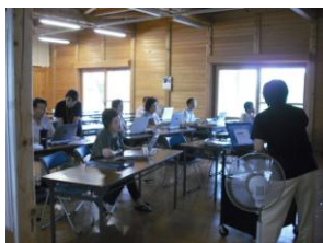
真剣な表情で機能を覚えていく参加者

最初のうちは操作に苦労していましたが、繰り返し行うことで少しずつ覚え、「機能の操作ができた」「自分でも色々な機能を試してみたい」等の声もあり、皆さんに興味を持って頂いた講座となりました。