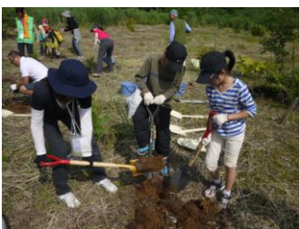
ブナの苗を植えました

秋田ではあきたパートナーシップが担当し、NPO法人冒険の鍵クーンが当日の受け入れ・実施を行いました。現地では子どもグループ、大人グループに別れてブナの原生林を様々な動植物について説明を受けながら歩き、桃洞の滝周辺で昼食、鳥獣保護センターで振り返りをしたのち、ブナとトチの植樹を行いました。