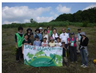
青空と植えたブナの木をバックに記念写真